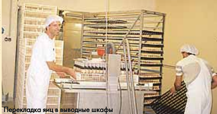
Перекладка яиц в выводные шкафы