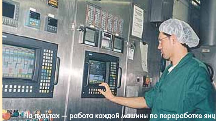
На пультах — работа каждой машины по переработке яиц