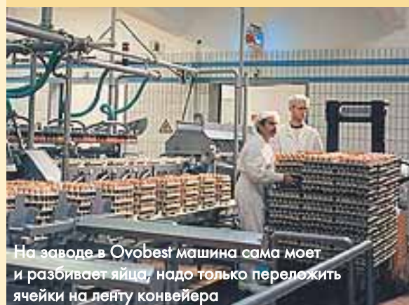
На заводе в Ovobest машина сама моет и разбивает яйца, надо только переложить ячейки на ленту конвейера