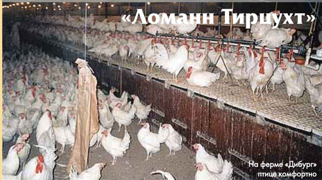
На ферме «Дибург» птице комфортно

в «ЛСЛ Рейн-Майн» принимают только с сельскохозяйственным образованием, и прежде чем приступить к работе, они три месяца проходят практику на всех производственных участках фирмы и еще шесть недель — в регионе, куда будет поступать продукция, а также участвуют в семинарах по маркетингу.